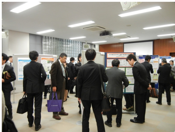
写真2 ポスターセッション