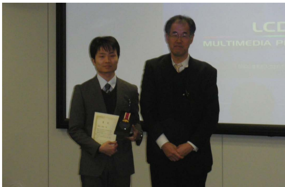
写真 受賞式の様子

新世紀新人賞は、関東支部に所属する若手研究者を発掘し、奨励すると共に、分析化学会奨励賞も視野に今後の研究の精進を後押しする賞であると受け止めています。従いまして、本新世紀新人賞の受賞(2015年1月)を励みに、奨励賞を目指して、より一層の精進をして参る決意をいたしました。その後、選考を経て2015年度日本分析化学会奨励賞を2015年9月に受賞することができました。これも、関東支部の皆様のお陰と感謝しております。今回の受賞を励みに、今後も研究を発展させて参りたいと考えております。また、微力ではありますが、関東支部の益々の発展に貢献して参りたいと思っております。今後とも皆様のご指導・ご鞭撻をどうぞよろしくお願い申し上げます。